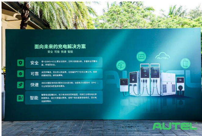
图 1：面向未来的充电解决方案