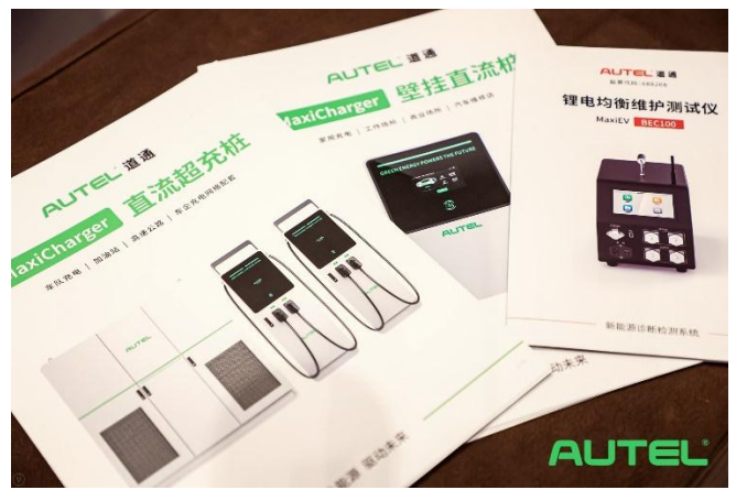
图 2：部分新能源产品