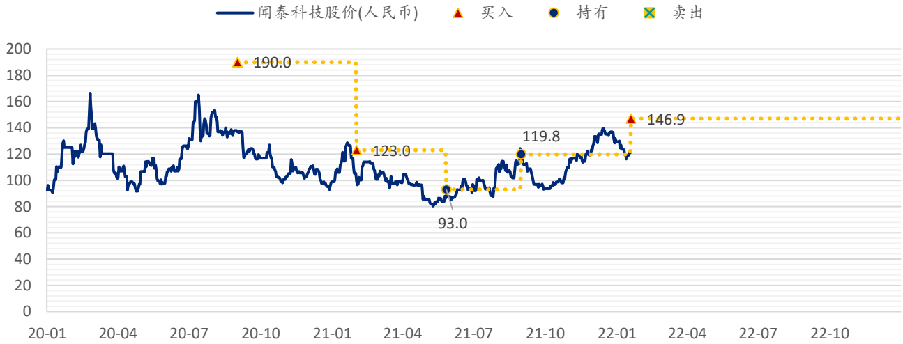
图表 2：浦银国际目标价：闻泰科技