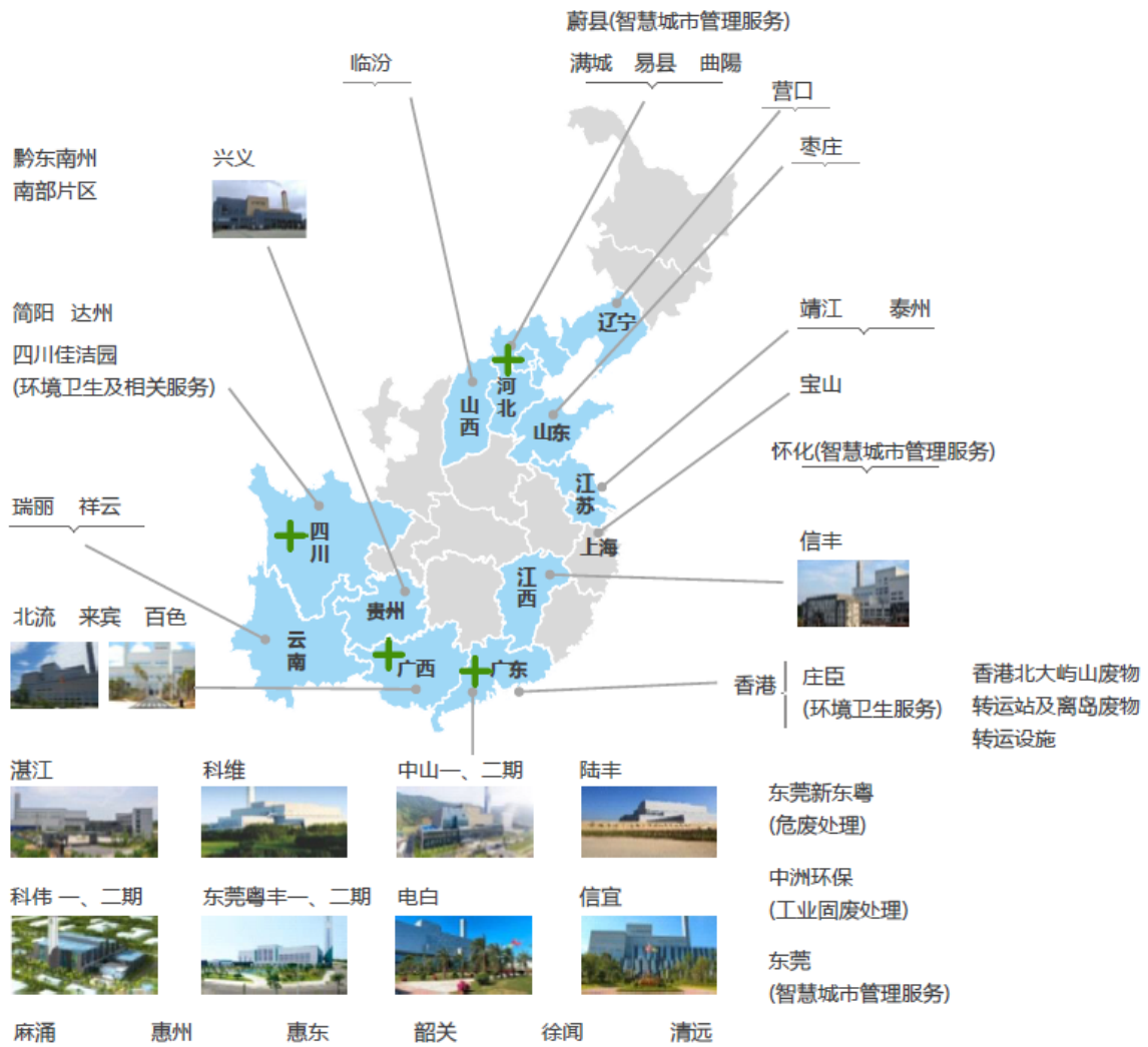
图表 2：公司业务布局