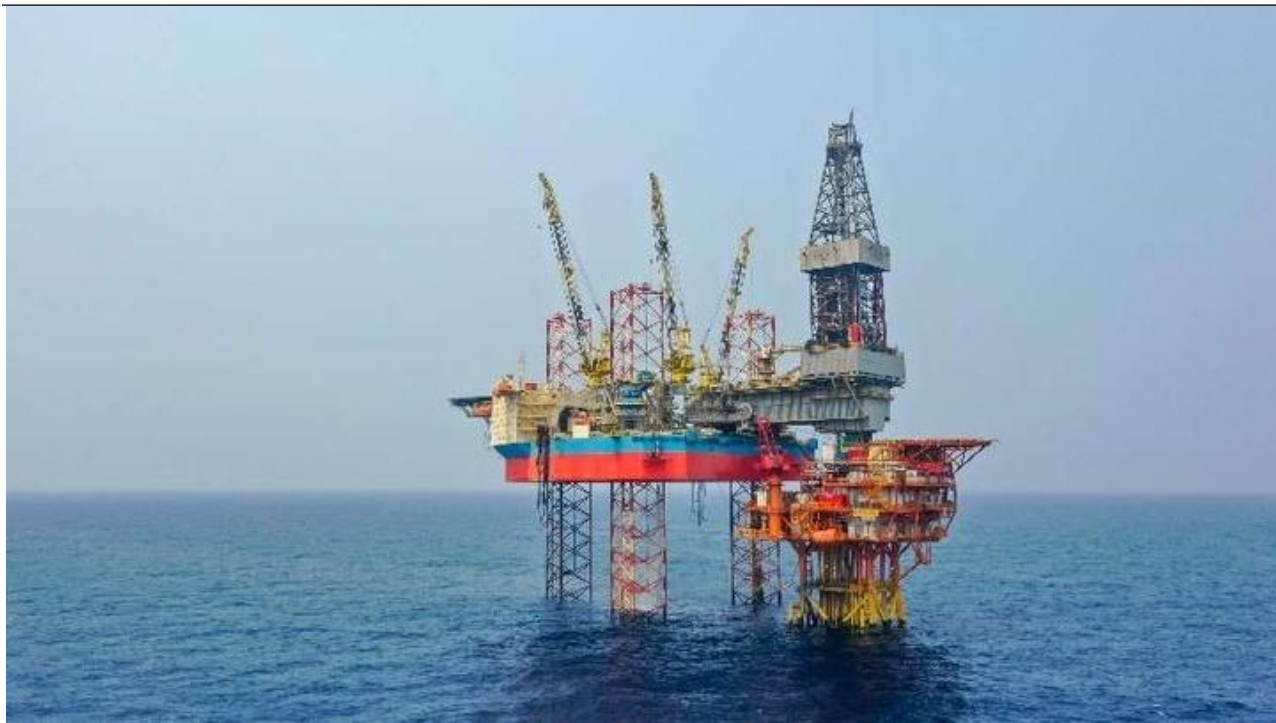
图1：恩平 21-4 油田海上平台

大位移井技术的特点是其轨迹并非垂直向下，而是在达到特定深度后，以“拐弯”的方式横向钻进至预定的油区，能对远距离、小储量的油气田进行精准、高效开发，为海上复杂地带油气开发提供技术支撑。在恩平 21-4 油田项目中，超深大位移井的水垂比高达 4.43。大位移井技术的成功应用，预计将帮助南海东部边际油田的储量扩增超过 5000 万吨，为我国的能源安全发展提供有力保障。