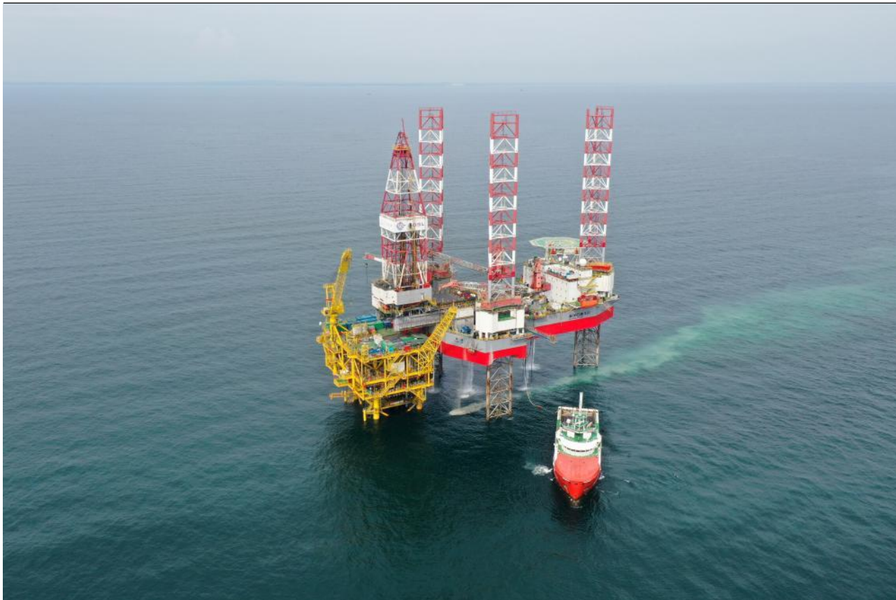
图2: 乌石 23-5 油田海上平台