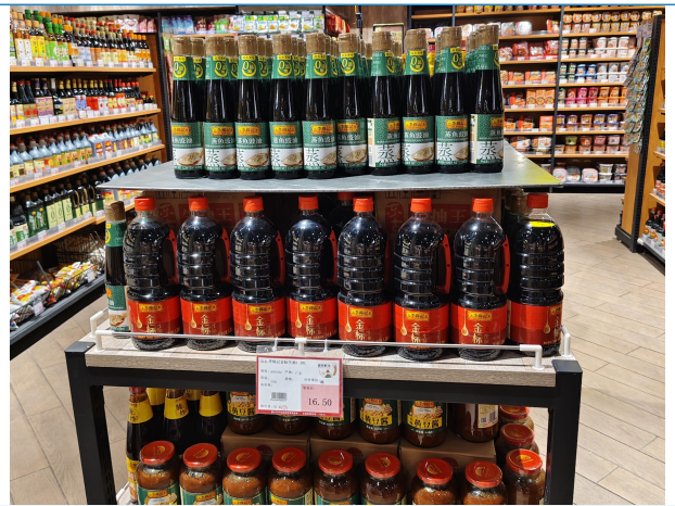
图 4：河北唐山商超调研调味品