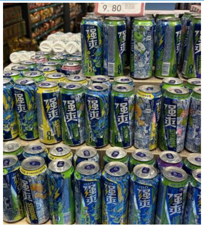
图 21：河南商丘睢县强爽堆头