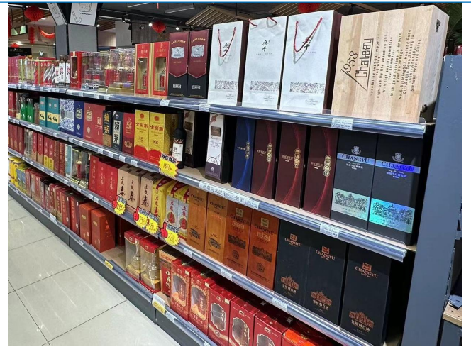
图 16: 四川成都商超调研白酒