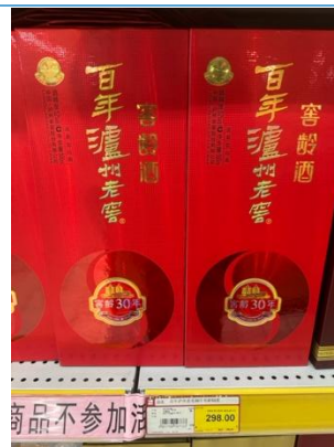
图 10：湖州春节期间畅销白酒