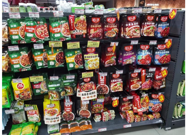
图 23：山东泰安新泰商超复合调味礼包