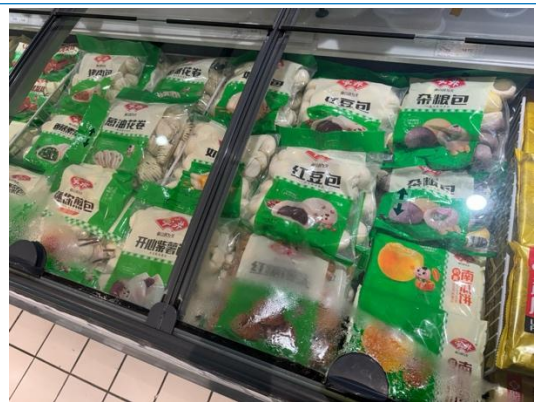
图 14：湖州商超安井货柜