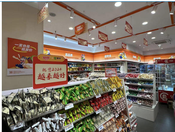
图 19: 四川成都零食量贩店调研 2