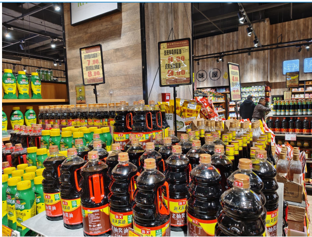
图 3：河北唐山商超调研调味品