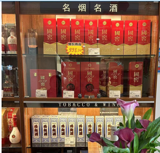
图 15: 四川成都商超调研白酒

口粮酒以本地酒为主，洋河认可度略低。1) 郎酒：零售价歪嘴 18.8 元（100ml 口粮酒）、红十 399 元，红十五 599 元。2) 丰谷：丰谷特曲 118 元，丰谷酒王 398 元。3) 洋河：海天梦在四川销售表现不好，消费者对于川酒和贵酒的接受程度比较高，对于苏酒不认可，口感难以接受。零售价格，海之蓝 208 元、天之蓝 398 元、M3 600 元、M6+ 800 元。