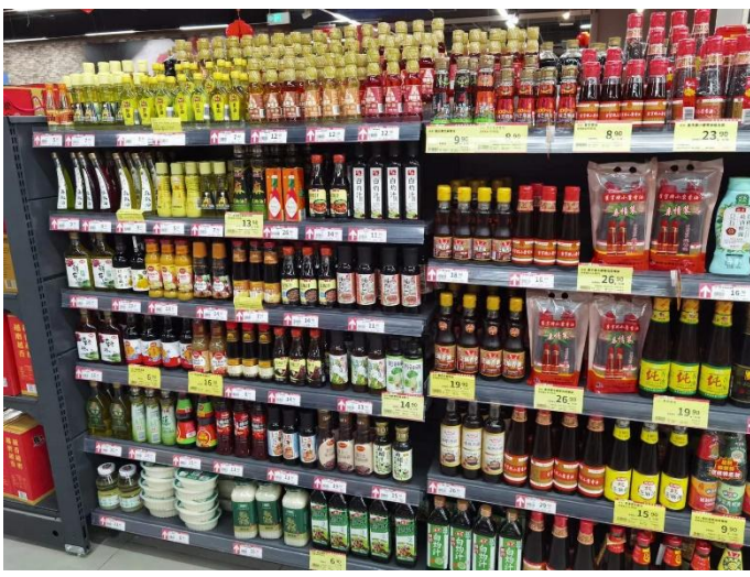
图 22：山东泰安新泰商超复合调味汁