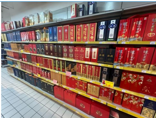
图 9：湖州商超白酒货架