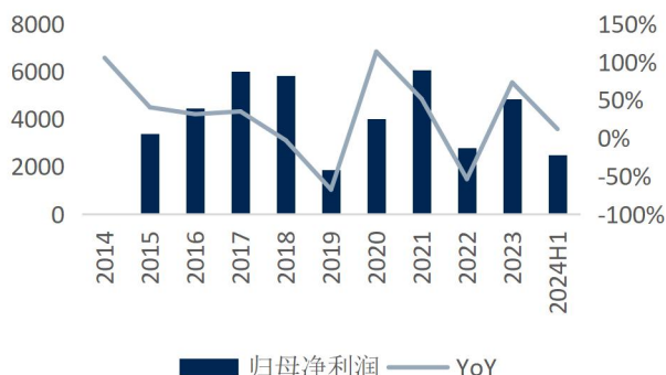
图2: 公司归母净利润及增速 (单位: 百万元、%)