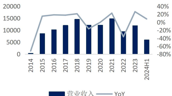
图1: 公司营业收入及增速 (单位: 百万元、%)

营收及净利润增长稳健，Q2 增速进一步提升。 公司披露 24 年上半年财报：1) 上半年实现营业收入 59.67 亿元、归母净利润 24.93 亿元，同比分别增长 8.17%、11.74%；对应摊薄 EPS 0.17 元；实现扣非归母净利润 21.97 亿元、同比增长 11.43%；2) Q2 单季度公司实现营收 32.388 亿元、归母净利润 14.53 亿元，同比分别增长 10.0%、12.6%，对应摊薄 EPS 0.10 元；营收与归母净利润增速相比一季度进一步改善；3) 24 年中期公司计划向全体股东每 10 股派发现金 1.00 元（含税），不实施资本公积转增股本、不分红股。