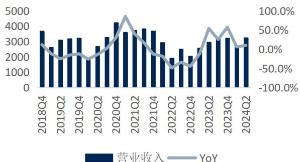
图3: 公司单季度收入及增速 (单位: 百万元、%)