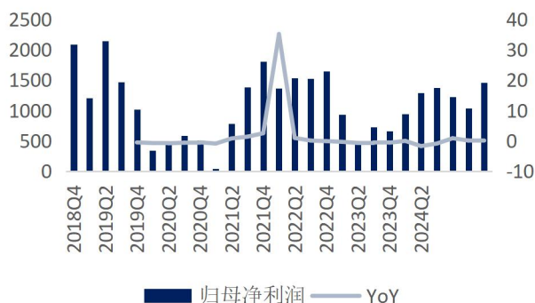
图4: 公司单季归母净利润及增速 (单位: 百万元、%)