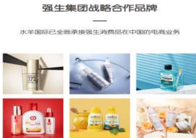
图 2：水羊国际 19 年与强生集团达成战略合作

生物”、“水羊智能制造基地”、“水羊科技”等多个业务板块，“水羊”已逐步成为公司的整体企业形象。