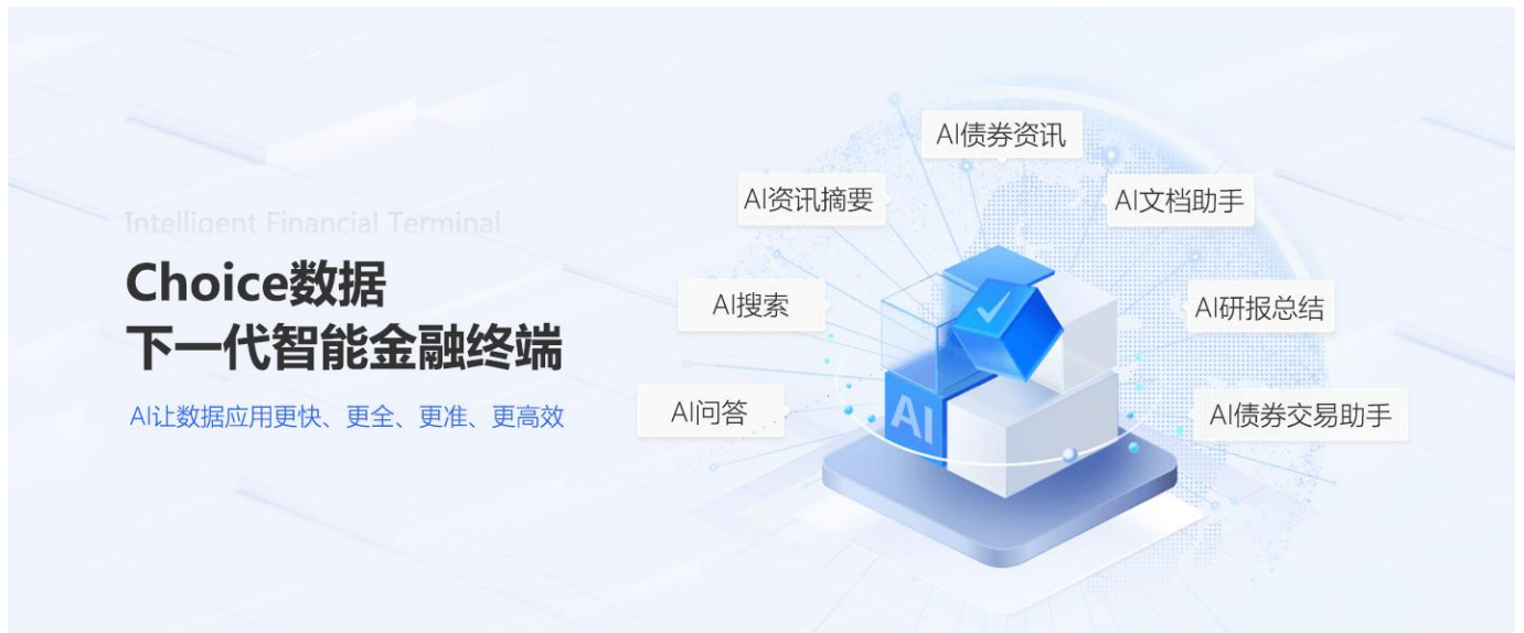
图 1：Choice 智能金融终端-7 大 AI 场景